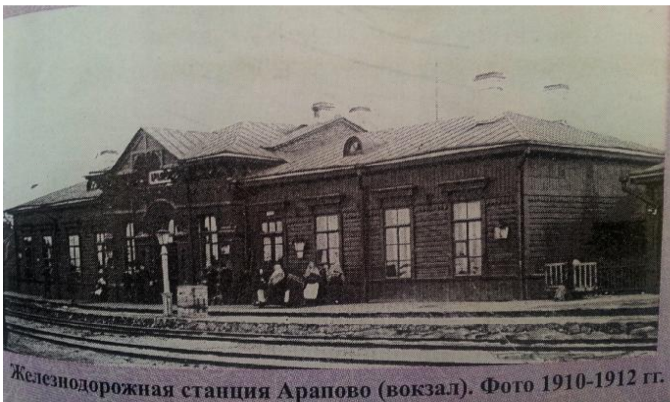
Железнодорожная станция Арапово (вокзал). Фото 1910-1912 гг.