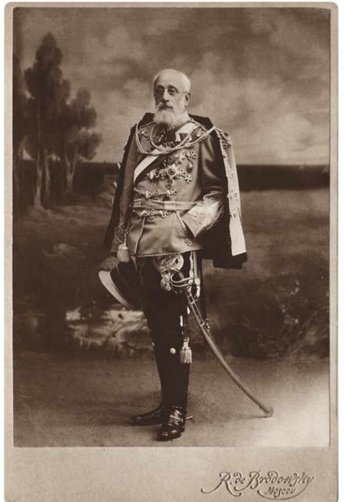
R. de Bredon & Co Nancy