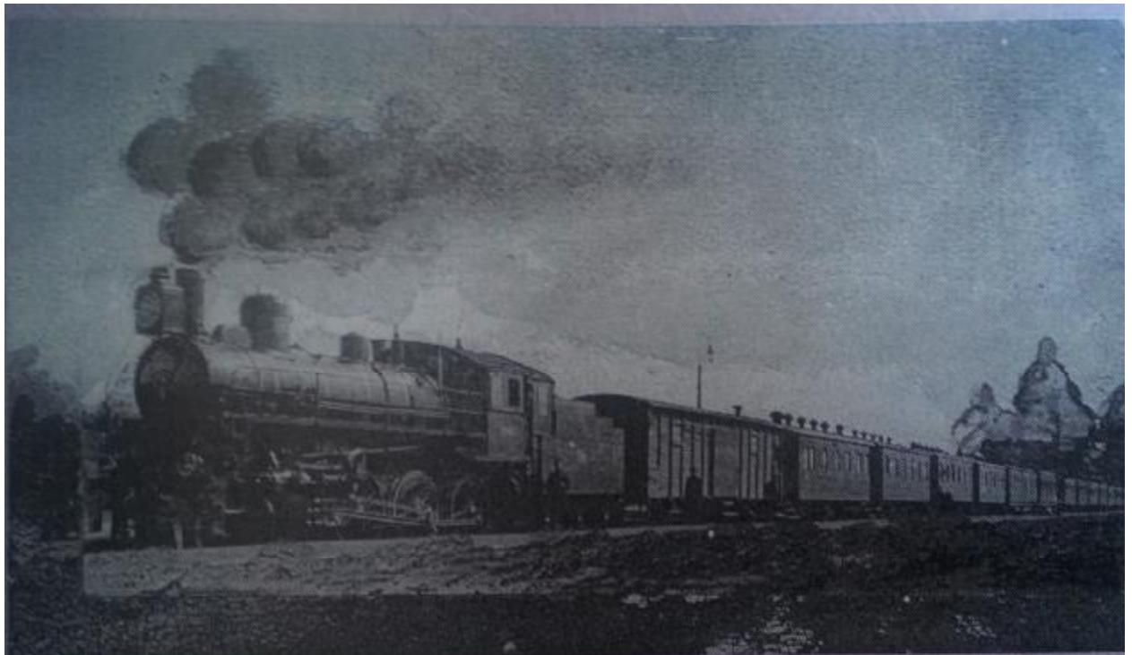
Пассажирский поезд. Ст. Арапово, 1910-1912 гг.