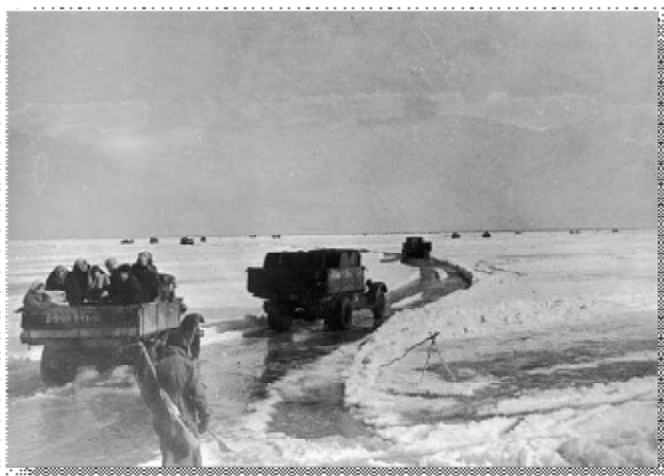
A17. «Дорога жизни»