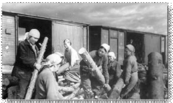
A13. Погрузка лесоматериала