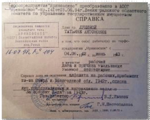
A16. Справка с места работы.