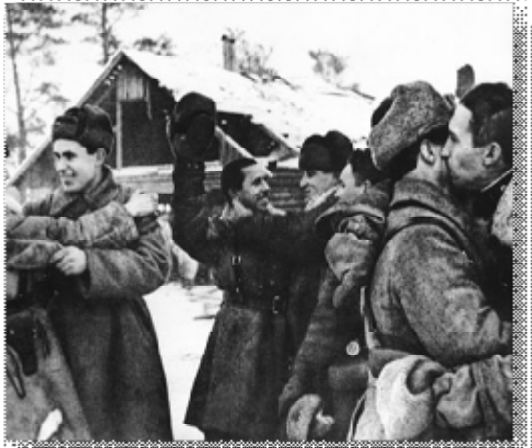
A20. Прорыв. Долгожданная Победа.