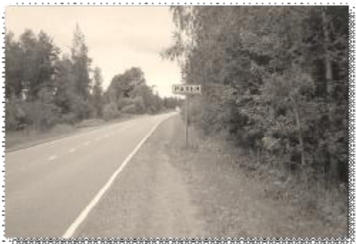
A14. Поселок Рахья