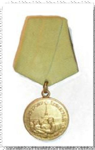
A22. Медаль «За оборону Ленинграда»