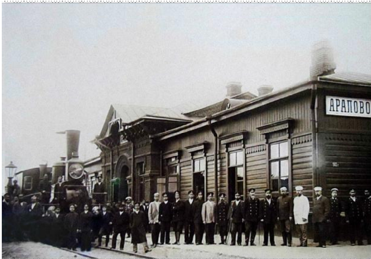
Приложение А5. (Железнодорожный вокзал).