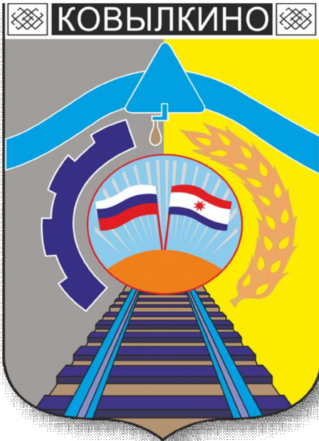
Приложение А1. (Герб города Ковылкино)